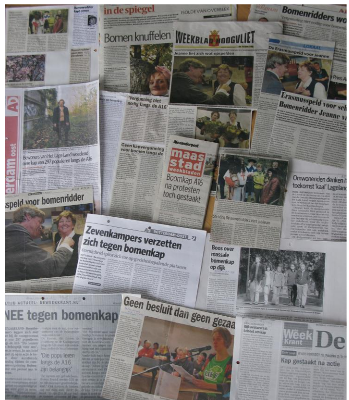
De Bomenridders waren ook in 2009 weer dikwijls in het nieuws

Het bestuur van Stichting de Bomenridders