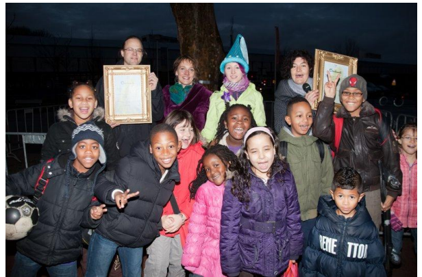
Oorkondes voor de werf Delfshaven en de Prinses Margrietschool

De werf Delfshaven en de directie van de Prinses Margrietschool krijgen beiden een oorkonde van De Bomenridders omdat zij 3 platanen hebben gered. De bomen moesten weg in verband met herinrichting van de Spaansweg. In het kader van het 'Groene schoolpleinenproject', dat kinderen spelenderwijs in aanraking met natuur en milieu wil brengen, heeft de Prinses Margrietschool de platanen geadopteerd.