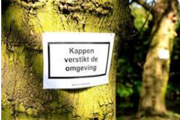
Protest tegen de voorgenomen kap van bomen langs de Achterdijk

Eind april trekt bewonersorganisatie Zestienhovensekade aan de bel. Het Hoogheemraadschap Schieland en Krimpenerwaard wil een deel van de boezemkade aan de Achterdijk ophogen en verstevigen. Daarvoor moet de beplanting verwijderd worden over een lengte van bijna een kilometer en een breedte van 5 meter. De plannen zorgen voor veel beroering bij de bewoners. In park Zestienhoven verdwenen al duizenden bomen voor de HSL, herinrichting van Rotterdam Airport, wegen en woningen. Nu moet ook dit groene lint met bomen van een halve eeuw oud