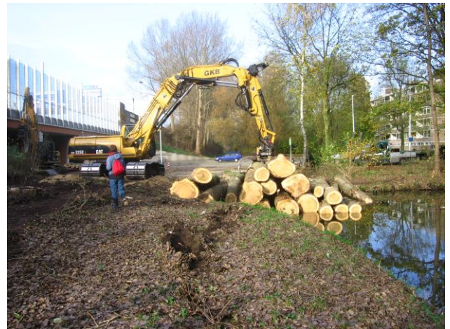
Kaalslag langs de A16 in Prinsenland

Per toeval horen wij dat Rijkswaterstaat 297 populieren langs de A16 in deelgemeente Prins Alexander wil kappen. De plannen zijn al 2 jaar bij de deelgemeente bekend, maar de bewoners weten van niets. Wij vragen om uitleg bij de deelgemeente en roepen de hulp in van GroenLinks. De partij vraagt een spoeddebat aan. Op 12 november ontvangen bewoners een brief van Rijkswaterstaat: de bomen worden in de week van 23 november geveld. Tot ons afgrijzen begint firma Kraaijeveld al een week eerder met hakken. Terwijl er, hebben we ontdekt, een kapvergunning nodig is voor bomen die meer dan 10 meter van de weg staan. Door ingrijpen van onze voorzitter, die toevallig aanwezig is als de zaagmachines met hun werk