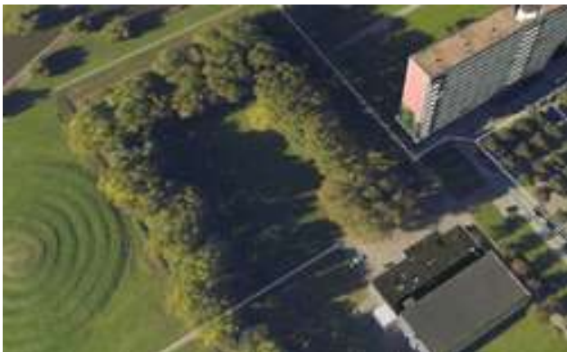
Het vogel- en vleermuisrijke bosplantsoen nabij het Bramanteplein, waar gemeente en deelgemeente een circa 63 meter hoge woontoren willen laten verrijzen.

wethouders wees alle zienswijzen begin december 2012 af. De circa 63 meter hoge Berninitoren zal in ieder geval ten koste gaan van een bosplantsoen met een aantal populieren. Tijdens de schouw ontdekten we grote bonte spechten en diverse spechtenholen. Tevens werden een roodborstje, koolmezen en een staartmees gesignaleerd, naast de geijkte vogelsoorten ekster, reiger, kauw en halsbandparkiet. Ook zitten er zeker drie verschillende soorten vleermuizen, zei een bestuurslid. Verder komen uilen graag op deze plek. Dit bijzondere bosplantsoen moet behouden blijven, vinden wij. Daarom steunen we de bewoners van de wijken Prinsensland en Het Lage Land, die zich verzetten tegen de komst van een tweede woontoren in het Prinsenspark.