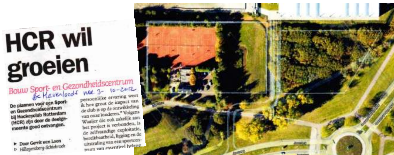
Hockeyclub Rotterdam wil graag uitbreiden met een sport- annex gezondheidscentrum (witte contour rechts) en een extra hockeyveld (witte contour links). Het gebouw is middenin een perceel met bomen en struiken gesitueerd. Daarnaast zit de buurman niet te wachten op een hockeyveld pal tegen zijn schuur.

Buitenruimte en medewerkers van Stadsontwikkeling, maar het plan lag al vast. De bomen en struiken die het veld omzomen, kunnen niet behouden blijven. Want juist op die plaats wordt een rondweg aangelegd. De bewoner die bezwaar maakte tegen de verleende vergunning voor het kappen van 47 bomen en 7.175 m 2 bosplantsoen, bleek niet belanghebbend. Daarvoor woonde hij net iets te ver van het terrein af, namelijk 103 meter in plaats van de toegestane maximumafstand van 100 meter. Om toch nog wat van het groen te redden, organiseerden bewoners op 15 december een boomverplantingsactie.