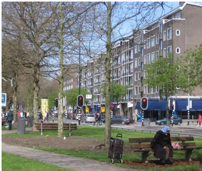
Op de foto zijn 4 van de 8 nieuw geplante, grote platanen aan de Mariniersweg te zien.

In het centrum van Rotterdam zijn in het voorjaar 43 nieuwe bomen aangeplant. En dan niet van de gebruikelijke 'sprietjes' (standaardmaat 16/18 cm stamomtrek), maar echt forse bomen waar je 'u' tegen zegt. Vier zilversdoorns met stamomtrekken tussen de 93 en 100 cm aan de Oostmolenwerf. Acht platanen met omtrekken van 63-79 cm aan de Blaak/Mariniersweg op een stenige vlakte, waarbij de stenen worden vervangen door gras. De Schiedamsevest is opgefleurd met 14 nieuwe bomen (stamomtrek 31 cm). Twaalf bomen staan in het talud bij het Russisch orthodoxe kerkje: 7 beuken en 5 Anna Paulownabomen; die bloeien heel mooi blauw in het voorjaar. Op het Willemsplein zijn 9 iepen geplant met een stamomtrek van 63-79 cm. Nummer 10 arriveerde in