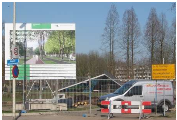
De 2 e fase van de herinrichtingswerkzaamheden in het Spinoza'park' startte half januari 2012.

'Het groene en waterrijke Spinozapark geeft een kwalitatieve aanvulling op de leefomgeving', pocht IJsselmonde op haar deelgemeentepagina. Waterrijk is het zeker op deze locatie, die meer gelijkenis vertoont met een veredeld weiland waar hier en daar een boom staat, dan met een park. Ondanks de extra waterberging is het er nog altijd drassig. Een half jaar na de start van de uitvoering van de 2 e fase maakte het voormalige groene hart van Lombardijen een troosteloze indruk. Het was hartje zomer, maar het leek wel herfst met 32 dode bomen aan de Pascal- en Spinozaweg. De (deel)gemeente liet een bodemonderzoek uitvoeren door het groentechnisch bureau Mol Agrocom-Boonman uit Oude Tonge. "De situatie in het deels gerenoveerde park gaf op het moment van ons bezoek een zeer natte indruk," aldus het onderzoeksrapport. "Een aantal bestaande kastanje en metasequoia bomen zijn reeds weggevallen. Overige nieuwe aanplant, waaronder acer en koelreuteria zijn eveneens niet of nauwelijks tot ontwikkeling gekomen en staan in het water." De onderzoekers stellen voor om zuurstof in de bodem te brengen. Ook is de aanleg van drainage nodig. Dat had van meet af aan moeten gebeuren, maar werd destijds te duur bevonden. Het Spinoza'park' is na alle ingrepen alles behalve groen gebleven of groener geworden. Sinds 2010 zijn er 96 bomen gekapt. Op het deel aan de Catullusweg, dat bij het 'park' zal worden gevoegd, zijn 11 bomen gekapt.