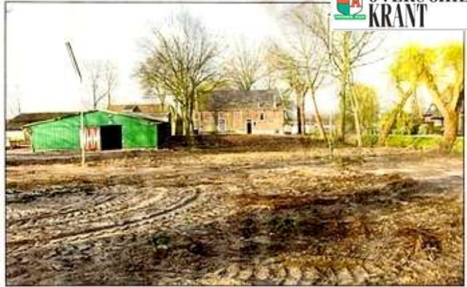
De verdwenen bomen aan de Overschiese Kleiweg.

De officier van justitie heeft vastgesteld dat u, Gemeente Rotterdam, zich schuldig heeft gemaakt aan het/de navolgende misdrijf(-ven)/overtreding(en), te weten dat: Omschrijving strafbaar feit Wetsartikel(en) Gemeente Plaats Locatie Datum Rotterdam Rotterdam Kleiweg 01-02-2011 Aan u wordt/worden de hierna genoemde sanctie(s) opgelegd: Opgelegde sanctie(s) een geldboete van € 5000,00 OVERSCHIESE - Gemeente Rotterdam moet een boete van circa 120 bomen op de locatie van de voormalige mangellocatie aan de Oude Kerkweg in Overschie. Het Openbaar Ministerie heeft bepaald dat de gemeente Rotterdam een schade van 5000 € inruikt. Ook is opgelegd de naastgelegen voormalige mangellocatie aan de Oude Kerkweg was getransformeerd gale kap aan de Oude Kerkweg in Overschie. Het Openbaar Ministerie heeft bepaald dat de schade van 5000 € inruikt. Ook is opgelegd