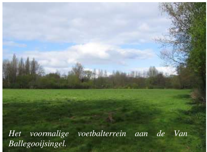
Het voormalige voetbalterrein aan de Van Ballegooijsingel.

Groene spechten scharrelen tussen het gras hun kostje bij elkaar en omwonenden met een hond wandelen er graag: op het voormalige voetbalterrein achter de Van Ballegooijsingel. Het is een oase van rust in een hectische stad. Maar net zoals de groenstrook achter de Verdilaan e.o. werd opgeofferd aan nieuwbouw, gaat ook dit terrein op de schop. Op het niet meer in gebruik zijnde sportveld zullen 25 vrijstaande woningen gerealiseerd worden. De Bomenridders en leden van Bewonersorganisatie Molenlaankwartier overlegden in maart met de portefeuillehouder