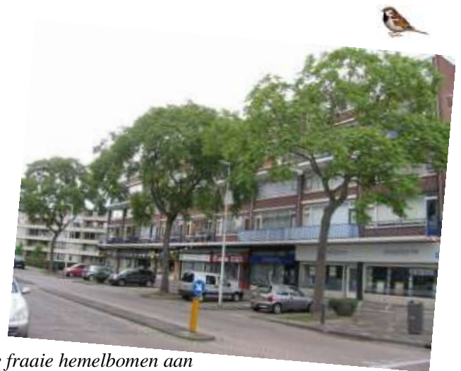
De fraaie hemelbomen aan de Schopenhauerweg die dreigden te verdwijnen voor rioleringswerkzaamheden en herbestrating.

bomen. Het was toch belangrijk om deze bomen te behouden? Van bewoners horen we dat de bomen er al 50 jaar staan. Waarom gaat dan toch de zaag erin? Volgens de notitie zou de ophoging 'minimaal' zijn, 'hooguit 20 cm'. Maar in de laatste conceptbestektekeningen was dat circa 30 cm geworden en dat overleven de bomen niet, legde de werfbeheerder ons uit. Ondersteund door 17 bewoners dienden wij een bezwaar in tegen het kappen van gezonde, 50-jarige bomen vanwege 10 cm extra ophoging. Een bewoonster zamelde daarnaast nog 153 handtekeningen in. Wij pleitten bij de bezwaarschriftencommissie voor alternatieve, boomvriendelijke oplossingen, zoals het ophogen met lichter materiaal of het toepassen van boomkragen. Mensen beseffen het dikwijls niet, maar aan een gezonde, volgroeide boom hangt ook een prijskaartje. De hemelbomen aan de Schopenhauerweg werden getaxeerd op € 8.500,- tot € 11.000,- per stuk. De werf paste het plan aan en liet 3 hemelbomen - waarvan één van 'matige kwaliteit' - aan de Schopenhauerweg staan.