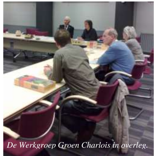
De Werkgroep Groen Charlois in overleg.

Naar aanleiding van de nota ‘Groen Charlois, Meerjarenvisie 2012-2020’, in september 2011 vastgesteld door de deelraad, werd de Werkgroep Groen Charlois in het leven geroepen. In 2012 zijn vijf bijeenkomsten georganiseerd. De deelnemers ontmoetten elkaar voor het eerst op 26 januari. Zij vertegenwoordigen verschillende wijken in Charlois. Ook afgevaardigden van stichting De Bomenridders en bureau Stadsnatuur Rotterdam schoven aan. Twee beleidsambtenaren, een landschapsarchitect en de beheerder van de werf vormen samen het kernteam, dat de Werkgroepleden begeleidt. Uit de groennota zijn tien onderwerpen gekozen waarmee de Werkgroepleden aan de slag zijn gegaan. Voorbeelden zijn: ‘groene erfafscheidingen’, ‘vergroening versteende wijken’ en ‘siergroen op beeldbepalende locaties’. Op basis van zes wandelingen door verschillende Charloisse wijken zijn kaarten gemaakt. Hierop zijn beeldbepalende locaties aangegeven en belangrijke plekken die voor vergroening in aanmerking komen. Medewerkers van bureau Stadsnatuur brachten de zones in kaart die kansrijk zijn voor de ecologie. Zo is langs het Havenspoorpad het oranjetipje weer te zien sinds 2012. De deelraadfracties toonden unaniem hun tevredenheid over de uitvoering van de groennota tijdens de Raadstafel eind november.