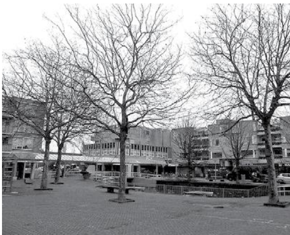
De bomen op het Ambachtsplein, met op de voorgrond de 4 platanen.

Bewoners uit de wijk Zevenkamp maken zich grote zorgen over de bomen op het Ambachtsplein . Amper een jaar na een opknappbeurt, waarbij nieuwe vuilnisbakken, bankjes en tafeltennistafels zijn geplaatst, dreigen 4 platanen, 10 bolacacia's en 15 kastanjes te sneven. Reden: het Ambachtsplein wordt geheel opnieuw ingericht in het kader van de zogenaamde 'Aquarelprojecten'. "Het trieste van dit alles is dat vooraf totaal geen communicatie heeft plaatsgevonden richting bewoners, omwonenden, bewonersorganisatie en winkeliers," schrijft een bewoonster in de Zevenkrant van januari/februari 2010. Ze stapt naar de Bewonersorganisatie Zevenkamp (BOZ). Ook onze hulp wordt ingeroepen. De BOZ en De Bomenridders worden uitgenodigd voor een spoedoverleg met 7 ambtenaren. Zij vertellen dat 'Aquarel' tot doel heeft om 'gezichtsbepalende plekken' weer een 'knap aanzien' te geven door het groen te verbeteren, nieuwe bestrating aan te leggen en de verlichting uit te breiden. Het kappen van 29 volgroeide, gezonde bomen staat hier haaks op, vinden wij. Net als de BOZ en verschillende bewoners dienen wij een bezwaar in tegen dit onzinnige en geldverspillende plan. Vooral de markante platanen,