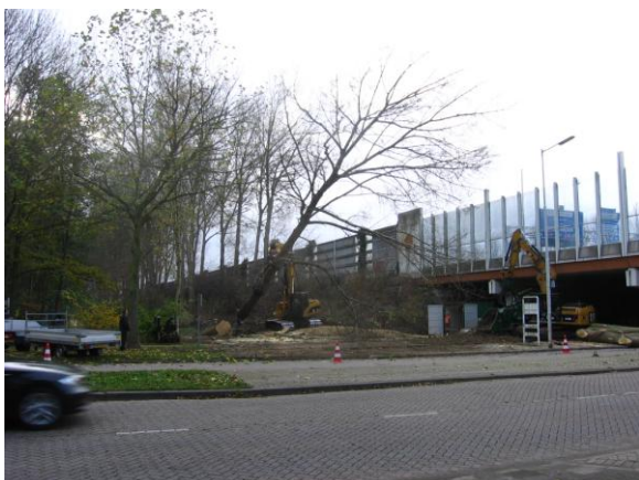
De populieren langs de A16 mogen worden omgezaagd, beslist de rechter medio februari.

Woningbouwvereniging PWS wil 12 bomen kappen op het binnenterrein tussen de Isaac Hubertstraat en de Marnixstraat, waar nieuwbouw moet verschijnen. Volgens PWS is het kappen van de bomen, waaronder drie prachtige populieren, ‘noodzakelijk’. Maar als wij de bouwtekening bestuderen, zien wij dat er een tuin komt op de plaats waar de populieren staan. We dienen een bezwaar in omdat de bomen behouden kunnen blijven. Ook waarschuwen wij bewoners voor de op handen zijnde kap via brieven. Tijdens de hoorzitting blijkt dat de bomen helemaal niet zijn meegenomen in het bouwontwerp en dat ze op minder dan 1 m van de geplande funderingsmuur voor de parkeergarage staan. Dat is bijzonder spijtig, want zo is er geen plaats voor de wortels van de bomen en dus ook niet voor de bomen.