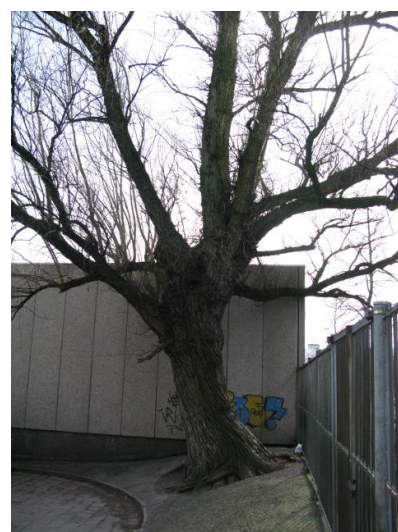
Indrukwekkende schietwilg op schoolplein in Dordrecht. Hoezo inferieure boomsoort?

In de deelgemeente Noord proberen we samen met enkele bewoners een kleine groene oase in de Hooglandstraat te behouden. Niet iedereen is echter van de wilgen en esdoorns gecharmeerd. Een bewoner klaagt over takken die tegen het raam tikken en een bewoonster vindt het zo donker in haar huis. In beide gevallen is snoeien ook een optie. Waarom de bomen meteen rigoureuus omzagen? Medewerkers van de werf halen hun neus op voor de bomen in het bosplantsoen die zij als inferieure snelgroeiers beschouwen: het zijn 'slechts' schietwilgen. Ook zien zij diverse potentiële, toekomstige gevaren (watermerkiekte, afbrekende takken). En het Ontwikkelingsbedrijf Rotterdam zou op de locatie azen. Kortom: alle redenen om het gebied 'op te schonen', zoals dat dan eufemistisch heet. Maar er zijn nog helemaal geen bouwplannen voor die plek. De volgende dag horen we dat de bewoners en De Bomenridders in het gelijk zijn gesteld. Het stukje postzegelgroen mag blijven! Een bewoonster kan haar plannen om een leuk wijkparkje van dit stukje groen te maken, nu eindelijk verwezenlijken.