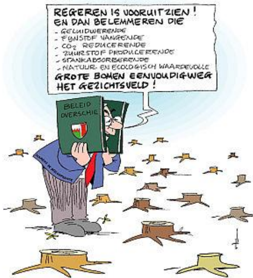
(Cartoon Ad Oskam)

zullen worden met bewoners over hoe de aangerichte schade hersteld kan worden. Het onderwerp groen blijft prominent op de Charloisse politieke agenda staan. De SP vindt dat de deelgemeente andere manieren van onderhoud en beheer van struiken moet onderzoeken, zoals eigen beheer door bewoners en onderhoud door vrijwilligers en stagiair(e)s. Alle politieke partijen zijn het met dit voorstel (motie) eens. De PvdA-fractie komt met een nota, 'Voor een groener Charlois. Groene bouwstenen voor het kader 2011-2020'. Deze ontwikkelingen stemmen ons hoopvol.