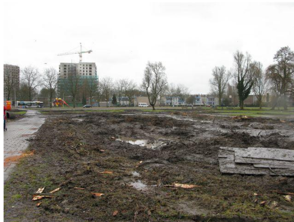
Een week voor de hoorzitting (1 maart) zijn de 62 bomen in het Spinozapark allemaal gerooid.

Eind januari dienen wij een bezwaar in tegen de verleende kapvergunning voor 62 bomen en 3.630 m 2 bosplantsoen in het Spinozapark . Het verwijderen van zoveel volgroeide, gezonde bomen en struiken is in strijd met de slogan "Het Spinozapark wordt het groene hart van Lombardijen". Ook vinden wij het opofferen van bomen voor meer ruimte voor water een kortzichtige en achterhaalde benadering. Ontwerpers vergeten dat groenstructuren - door de combinatie van schaduw, luwte en verdamping - een belangrijke microklimatologische waarde hebben. De bomen zijn al gekapt als de hoorzitting nog moet plaatsvinden. We troosten ons met de gedachte dat we 7 moerascipressen van de zaag hebben kunnen redden. Ook zijn we blij dat de bezwaarschriftencommissie vindt dat er 83 in plaats van 43 bomen herplant moeten worden. Dat zijn toch weer 40 bomen extra!