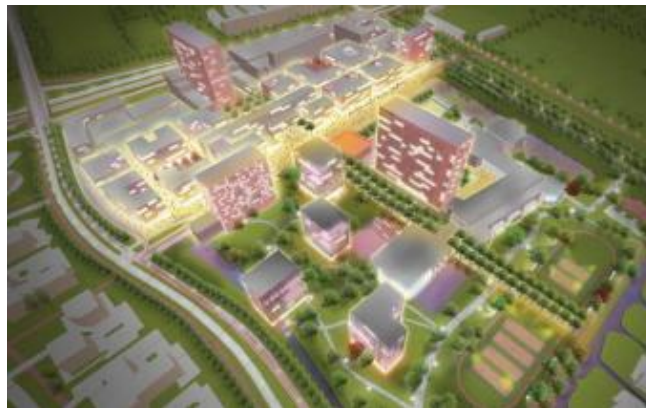
Ontwerp van campus Woudestein, met een landschappelijk deel in het noorden en verdichte bebouwing in het zuidelijke deel. (Ontwerp Juurlink+Geluk)

om onder andere een groenplan tegelijkertijd met de bouwschetsen te ontwikkelen, krijgen wij te horen dat ‘de zaag er goed in gaat’. Bijna 200 volwassen, gezonde bomen zouden al in september moeten sneven voor de bouwlogistiek en de grondberging. Wij sturen half augustus ons officiële standpunt naar de landschapsarchitect met als doel zo veel mogelijk bomen van de ondergang te redden. Medio september wordt de kapvergunning aangevraagd. De Bomenridders moeten hemel en aarde bewegen om het document te mogen inzien. Wij worden geconfronteerd met de extra kap van 3 wilgen langs de Groene Wetering, 6 schitterende suikeresdoorns vlak naast gebouw C en 13 platanen aan de Collegelaan. Deze voor ons volstrekt nieuwe feiten leiden tot nieuwe overleggen met de EUR, om beurten door bewonersvereniging BKO en De Bomenridders geïnitieerd. Ook vinden wij in oktober ruim 30 omwonenden bereid om ons te ondersteunen in een eventueel bezwaar.