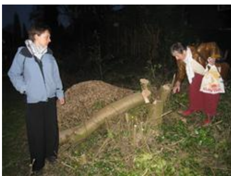
Gesloopt bosplantsoen uit bezuinigingsoverwegingen in Charlois

Niet alleen bomen worden voortdurend van alle kanten bedreigd, ook struiken zijn hun leven in Rotterdam niet zeker. Vanuit bezuinigingsoverwegingen heeft het dagelijks bestuur van de deelgemeente Charlois besloten om de hoeveelheid heesters drastisch te verminderen. Omdat er te weinig geld in het potje voor groenbeheer zit, gaan de struiken eruit. Daarvoor in de plaats komt gras, want gras vergt minder onderhoud. In een mum van tijd zijn hele wijken van struiken ontdaan, nota bene in het broedseizoen. Bewoners zijn niet (op tijd) ingelicht. Verontwaardigd roepen zij de hulp in van De Bomenridders. Daarom bezoeken wij een bewonersbijeenkomst en gaan wij het gesprek aan met deelgemeentebestuurders.