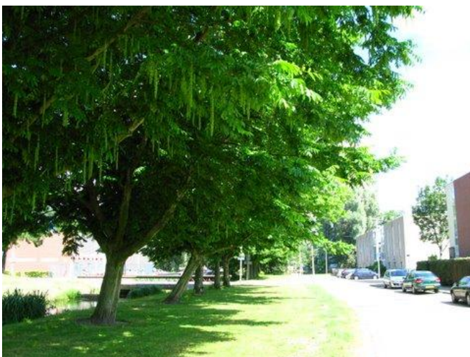
Prachtige, volgroeide vleugelnoten aan de Corrie Hartonglaan die tezamen een weldadig koelte-eiland vormen op hete dagen.

Op 1 oktober zitten De Bomenridders voor noppes bij de voorzieningenrechter. Wij hebben een verzoek om en voorlopige voorziening ingediend om te voorkomen dat 59 vleugelnoten aan de Corrie Hartonglaan worden omgehakt. Maar de deelgemeente Prins Alexander heeft op het laatste nippertje een brief naar de rechtbank gestuurd met de mededeling dat de bomen blijven staan tot de algemene bezwaarschriftencommissie een advies heeft uitgebracht. Wij trekken de voorlopige voorziening in en wachten de hoorzitting bij de deelgemeente af. Voor de vleugelnoten was in juli een