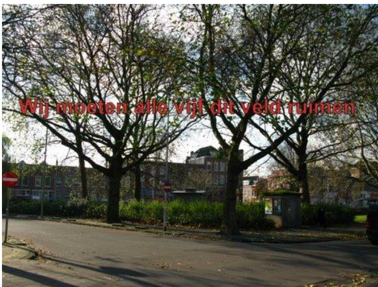
Vijf van de in totaal 17 bomen aan de Slaghekstraat. Dit schaarse groen vlakbij de Putselaan 'staat in de weg' voor een nog ter verrijzen stenen kolos en moet daarom verdwijnen.

Half november schrokken De Bomenridders van een aangevraagde kapvergunning voor 17 bomen aan de Slaghekstraat (deelgemeente Feijenoord) . Voor de zoveelste keer moeten volgroeide, gezonde bomen het veld ruimen voor een gebouw. De 3 dikste platanen (met omtrekken van 330 en 345 cm)